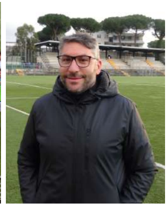
in foto d.t. Orefice