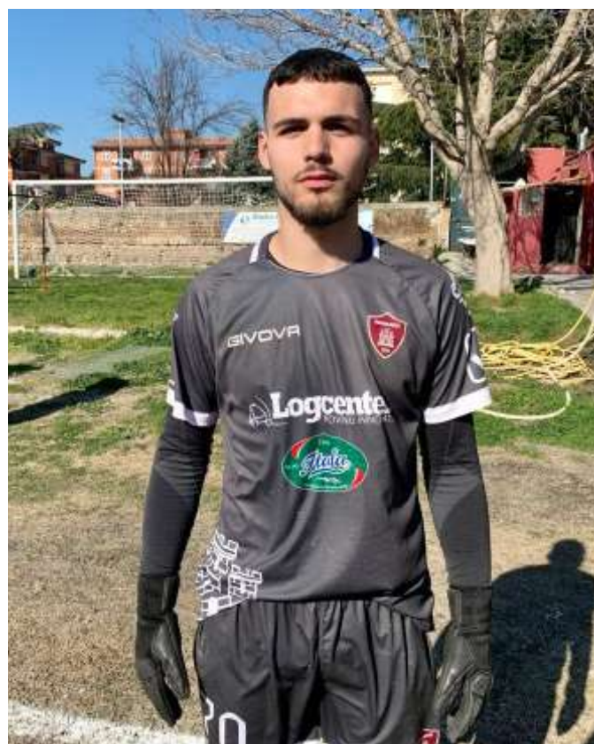
in foto Domigno

NOTE: giornata calda, spettatori cento circa, angoli 6-4