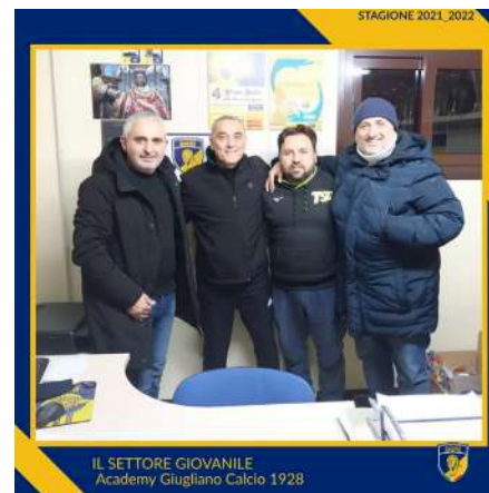
IL SETTORE GIOVANILE Academy Giugliano Calcio 1928