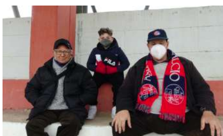
in foto tifosi storici

Ci auguriamo che ogni malinteso venga messo da parte per il bene comune del Cellole Calcio e poter ammirare allo stadio gli ultras. Negli occhi di tutti la passione, calore di ragazzi unici nel seguire ovunque la squadra del cuore.